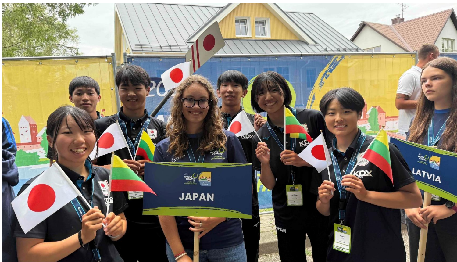
JAPAN プラカード担当になったボランティア STAFF と日本選手団

本日夕方からは、Opening Ceremony が開催され、Finish Tower からトラカイ島城まで、各国選手団が連なり、1.2 kmの大パレードとなりました！もちろん、我々U19 JAPAN TEAM も参加し、大会開催に向け、大いに盛り上がり、気持ちも高まりました！！