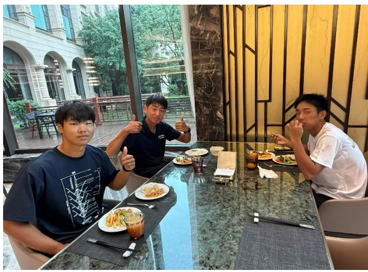
(ホテルでの食事の様子)

夕食後はバスで10分ほどのホテルに移動し、TEAM 写真撮影の指示がありました。日本は一番最初に撮影となりました！